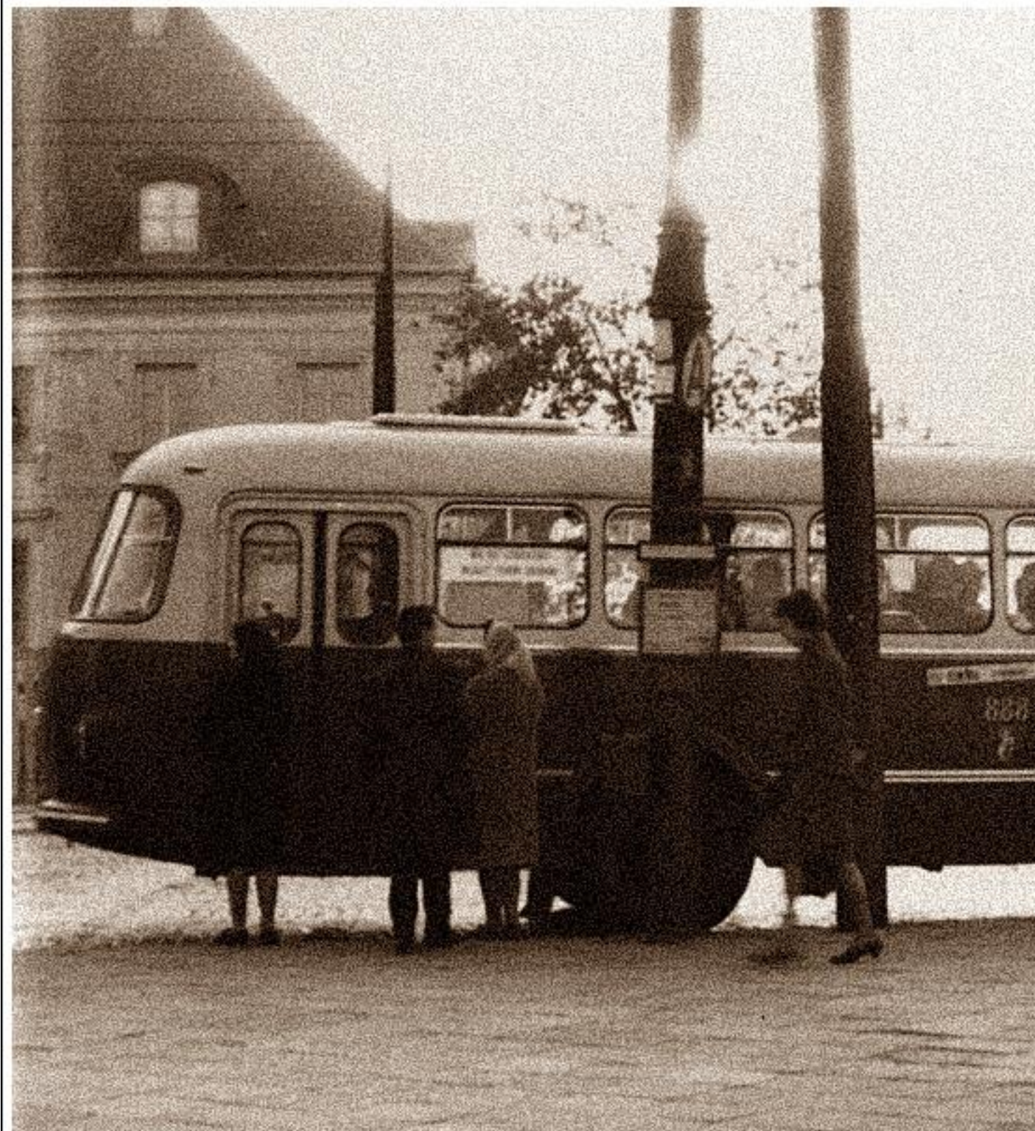
Jelcz Mex świeżo z fabryki. Pierwsza seria Jelczy bez świetlików z tyłu, ale je fabrycznie zderzakami. Nr tab. 888: produkcja 1964, R5, WW6279, od 29.03.1964 Plac Krasińskich - 1964

poniedziałek, 17 lutego 2014 19:10 - Poprawiony poniedziałek, 12 sierpnia 2019 21:57