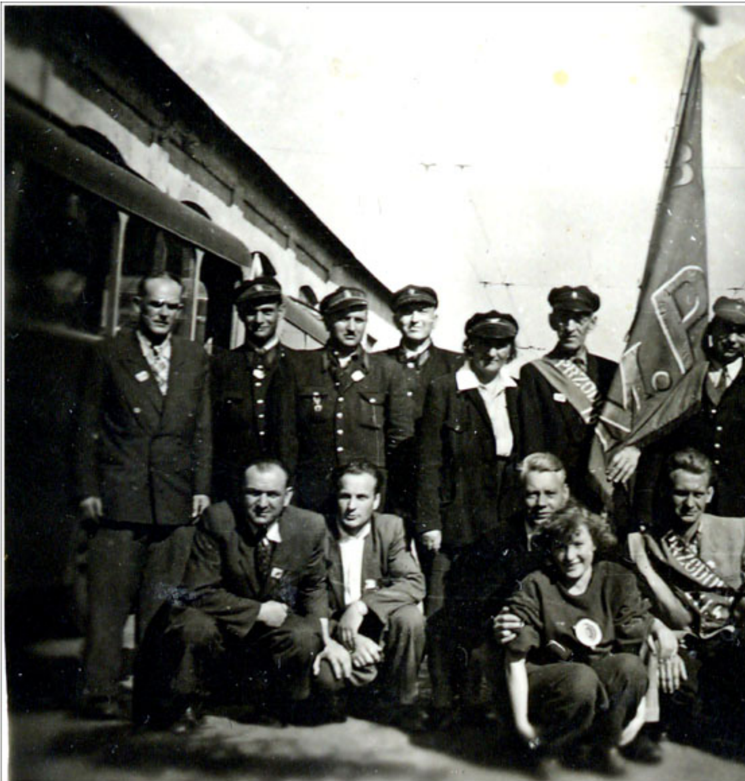
Zajezdnia "Łazienkowska" 1 maja 1952. Pracownicy Oddziału przed wyruszeniem na pochód 1-majowy

środa, 28 sierpnia 2013 18:38 - Poprawiony poniedziałek, 12 sierpnia 2019 21:48