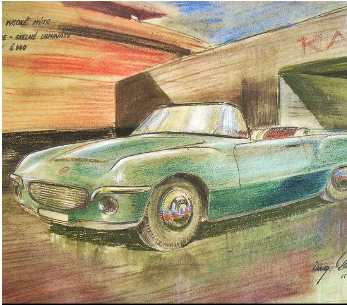
Rysunek koncepcyjny samochodu Skoda, autorstwa Otakara Diblík z 19

poniedziałek, 01 lipca 2013 21:04 - Poprawiony poniedziałek, 12 sierpnia 2019 21:45