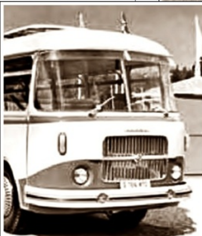
Koncepcja Skody 706 RTO wg f-y LIAZ 1956 Brno