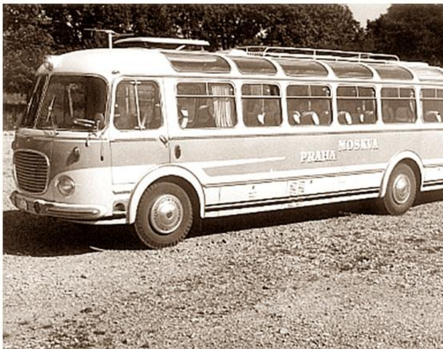
Skoda RTO Lux, która miała obsługiwać trasę Moskwa - Praga, wyjechał tylko raz na tę trasę

poniedziałek, 01 lipca 2013 21:04 - Poprawiony poniedziałek, 12 sierpnia 2019 21:45