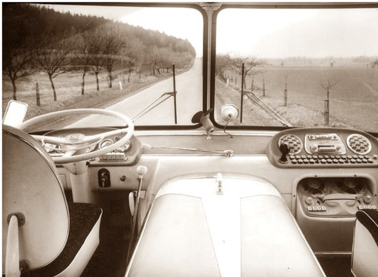
Wnętrze autobusu Skoda 706 RTO-LUX wersja Bruksela 1958 design Otakar Diblík

poniedziałek, 01 lipca 2013 21:04 - Poprawiony poniedziałek, 12 sierpnia 2019 21:45