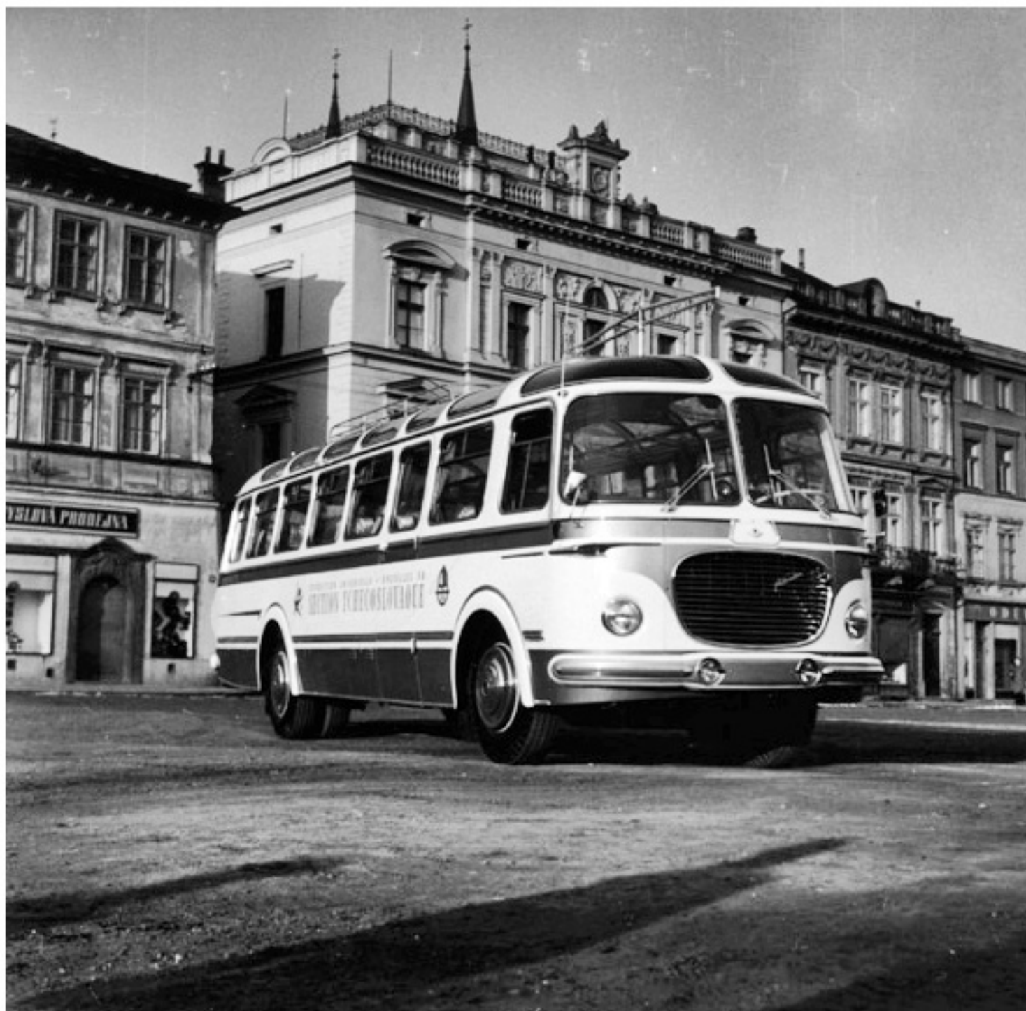
Skoda 706 RTO - wersja Bruksela 1958, pokaz przed wyjazdem na Expo 58

poniedziałek, 01 lipca 2013 21:04 - Poprawiony poniedziałek, 12 sierpnia 2019 21:45