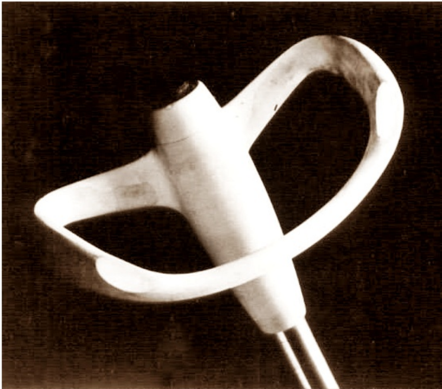
Wolant do samolotu Morawa autorstwa Otakara Diblika