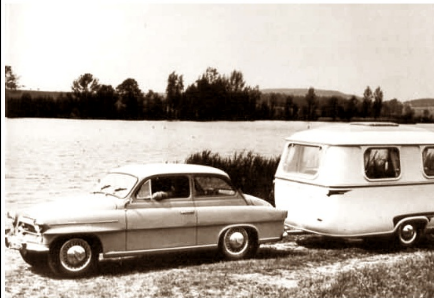
Przyczepa kampingowa Skoda - Jajko, autorstwa Otakara Diblika

poniedziałek, 01 lipca 2013 21:04 - Poprawiony poniedziałek, 12 sierpnia 2019 21:45