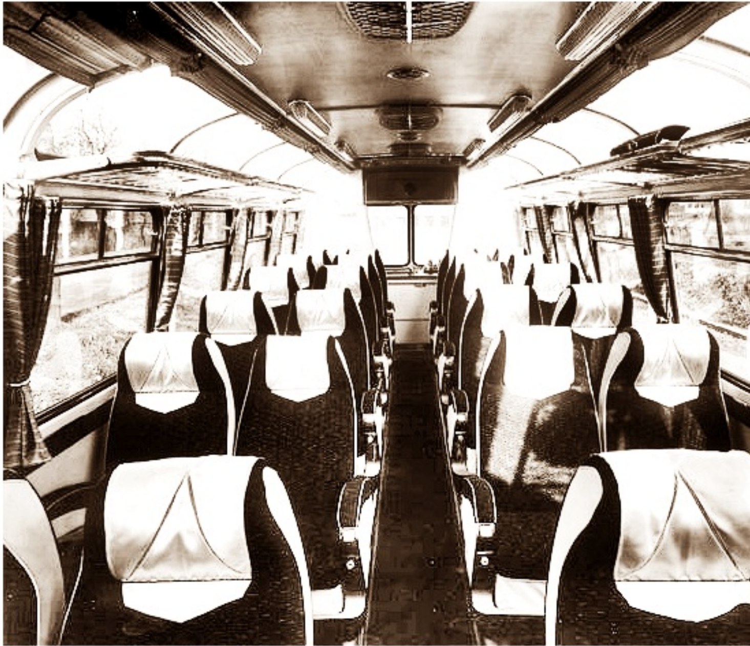
Wnętrze autobusu Skoda 706 RTO-LUX wersja Bruksela 19 design Otakar Diblík

poniedziałek, 01 lipca 2013 21:04 - Poprawiony poniedziałek, 12 sierpnia 2019 21:45