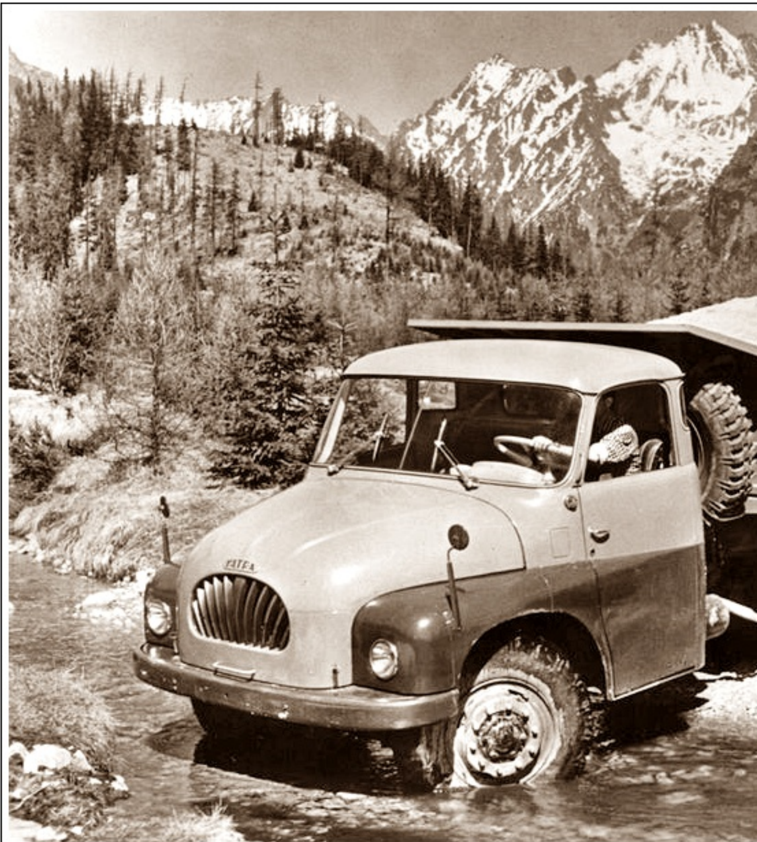
Tatra 138 Kropivnice, design Otakar Diblík

poniedziałek, 01 lipca 2013 21:04 - Poprawiony poniedziałek, 12 sierpnia 2019 21:45