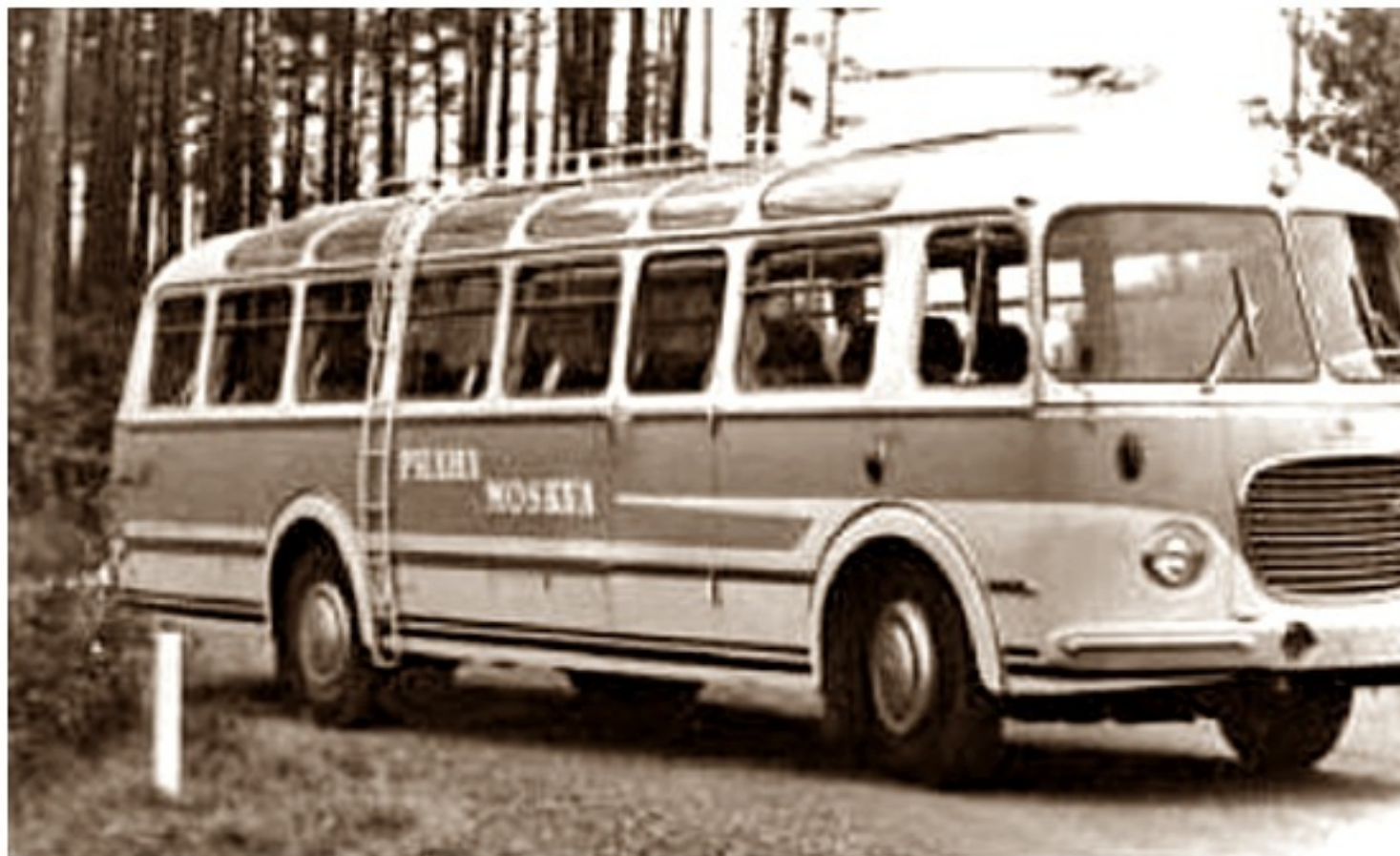
Škoda 706 RTO - LUX do obsługi linii Praha - Moskwa

poniedziałek, 01 lipca 2013 21:04 - Poprawiony poniedziałek, 12 sierpnia 2019 21:45