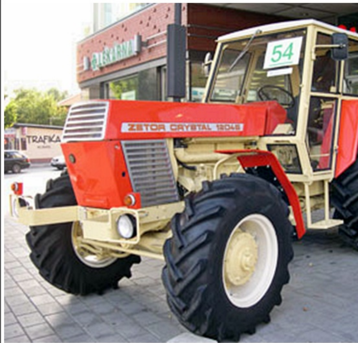
Projekt - wzornictwo przemysłowe Otakar Diblík

poniedziałek, 01 lipca 2013 21:04 - Poprawiony poniedziałek, 12 sierpnia 2019 21:45