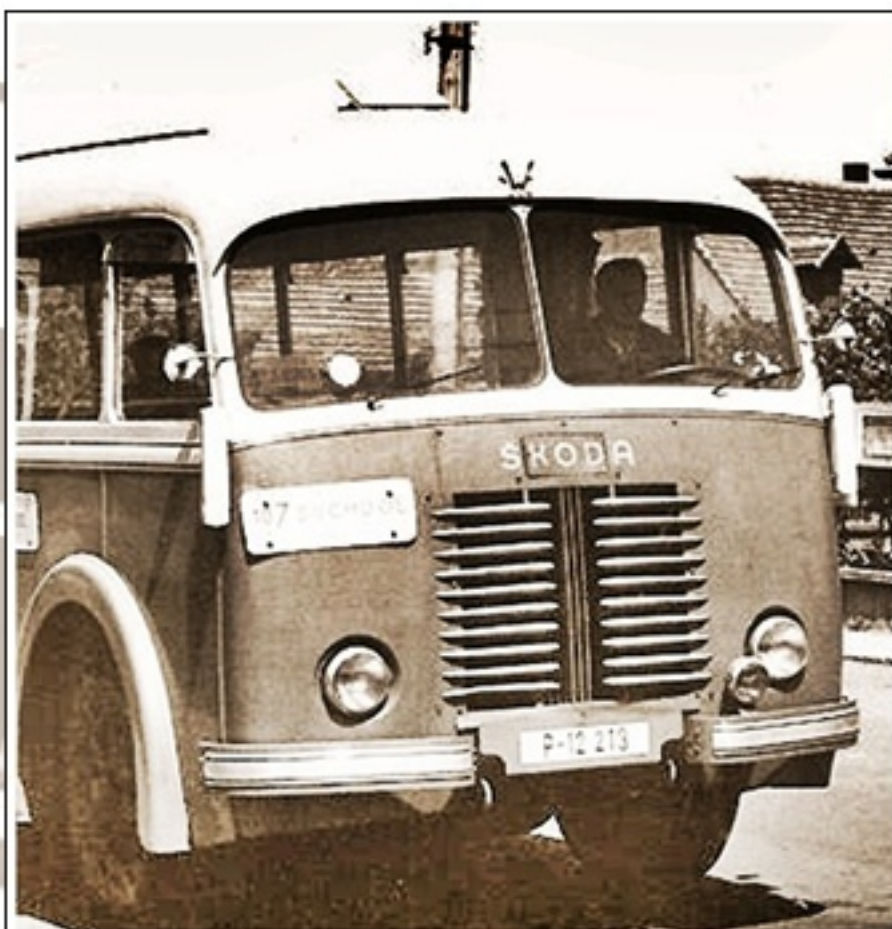
Stylistyka 1952 -1957

poniedziałek, 01 lipca 2013 21:04 - Poprawiony poniedziałek, 12 sierpnia 2019 21:45