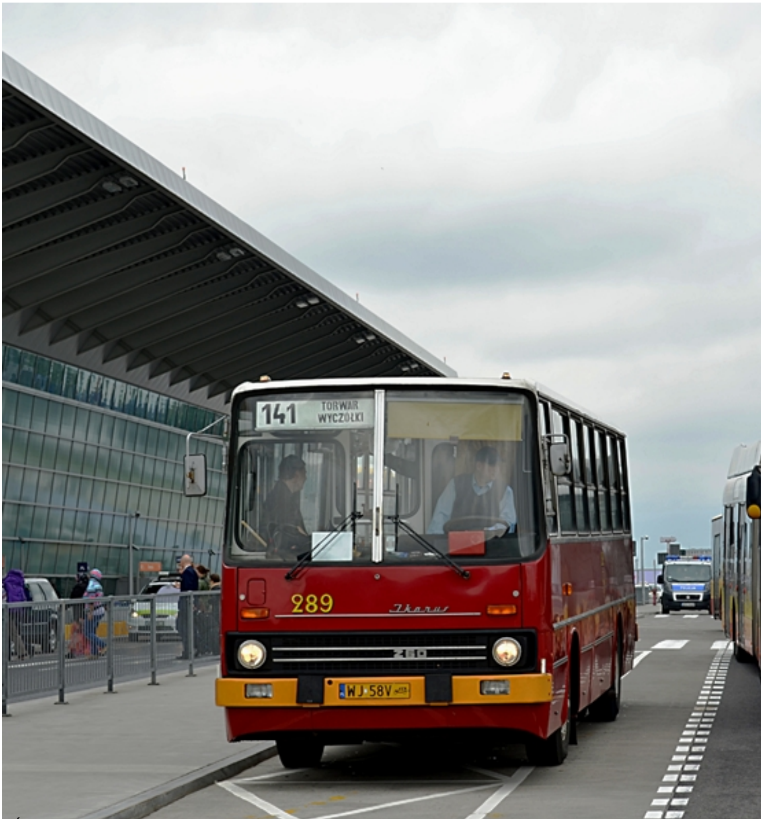
Stacja Obsługa (przystanek techniczny) na przystanek techniczny, gdzie kierowcy autobusów mają