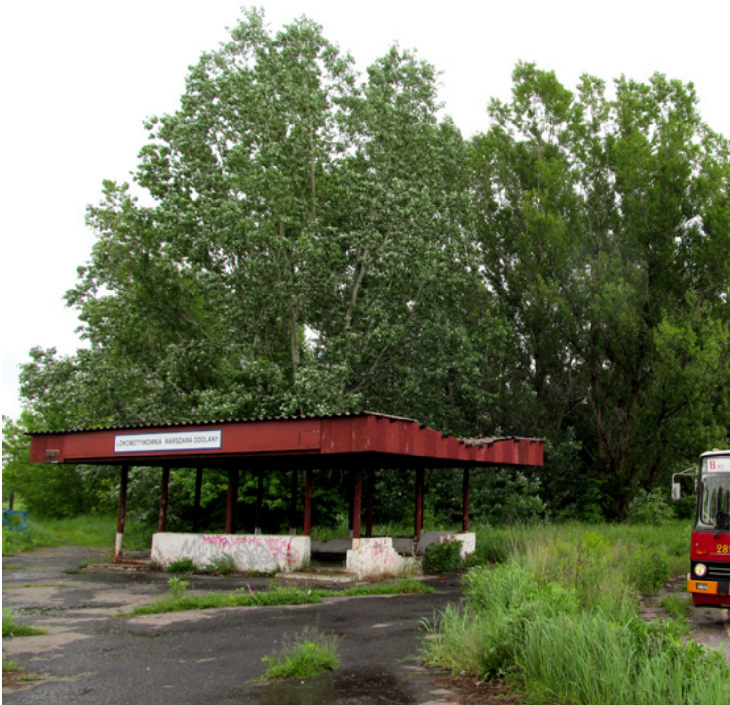
Namięsko Chopina (Lokomotywa - Sektor GDE) deo obsługująca linę OKęciu. Tutaj wykonano zdjęcie na prz